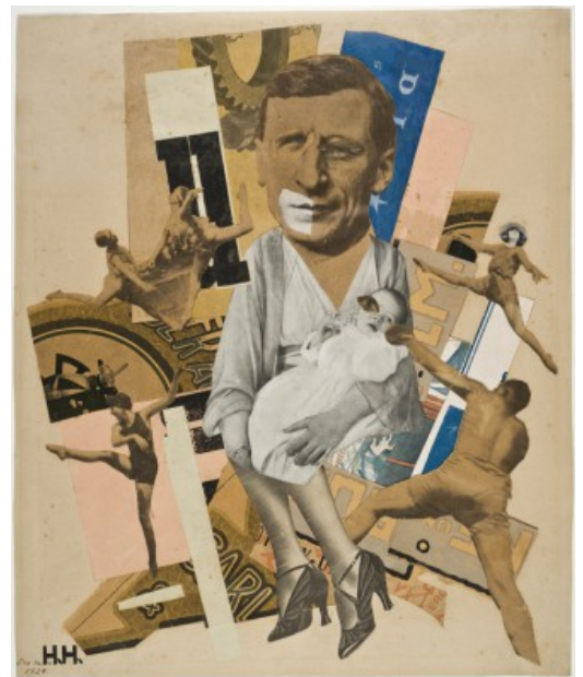
Hannah Höch, Der Vater, 1920,